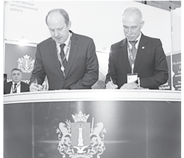
В Екатеринбурге были заключены соглашения о сотрудничестве области с РОСДОРНИИ и с Государственной транспортной лизинговой компанией.

На международной выставке регион представил опыт реализации нацпроекта, строи-